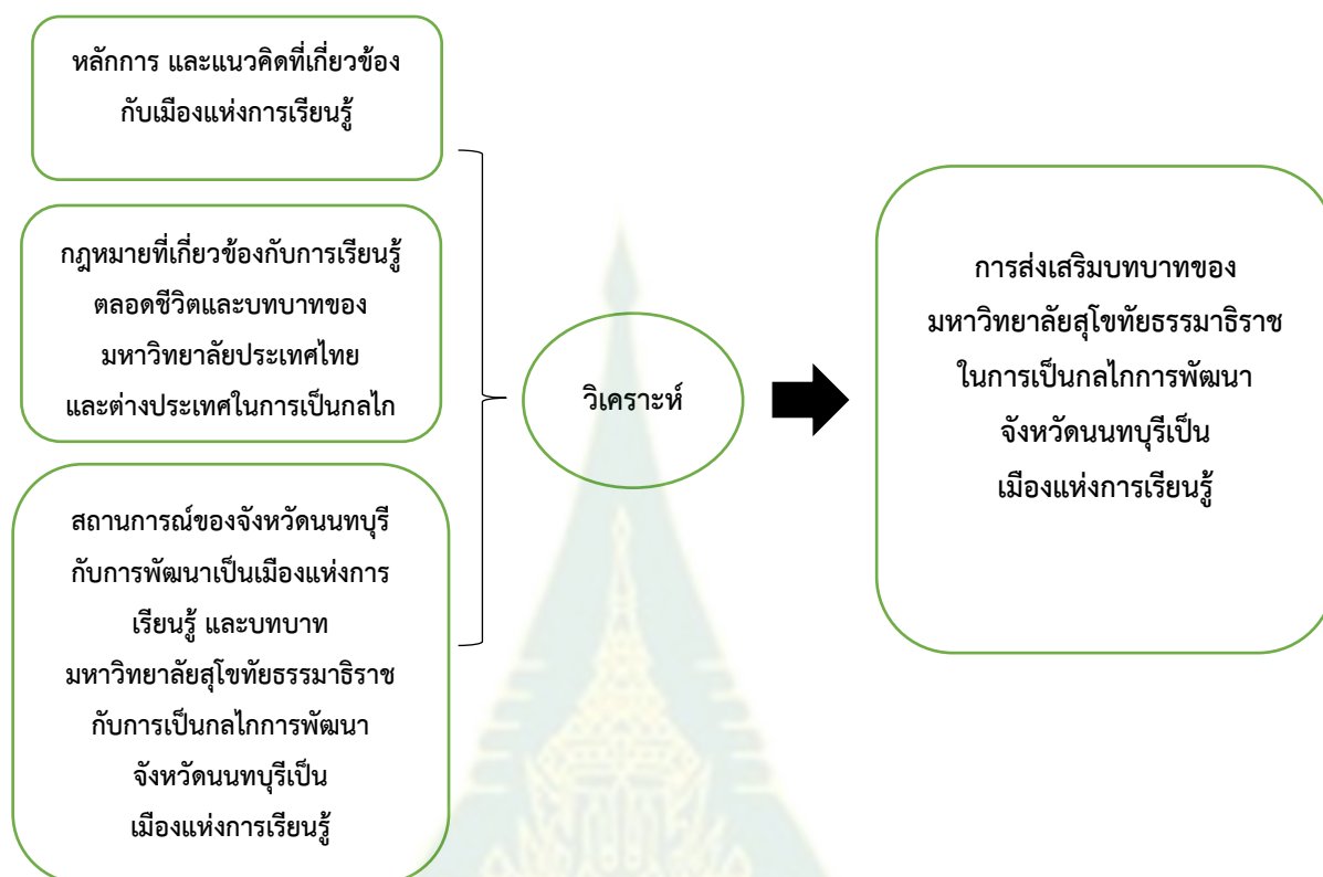
ภาพที่ 1.2 กรอบแนวคิดการวิจัย